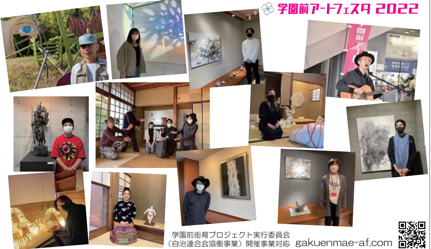
学園前街育プロジェクト実行委員会 (自治連合会協働事業) 開催事業対応 gakuenmae-af.com