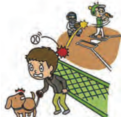
野球大会中のファウルボールで通行人がケガをした