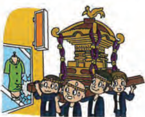
お祭りの神輿で商店のガラスを損壊した