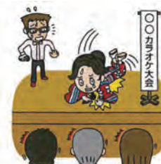
カラオケ大会に参加した住民がケガをして通院した