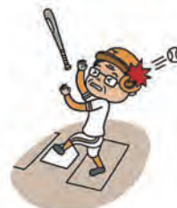
野球大会に参加した住民の親戚がケガをして10日間入院し、お見舞金を支払った