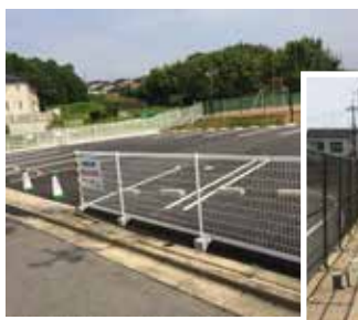
園舎工事に先立ち、仮駐車場・仮園庭の整備が5月に完了しました

新園舎の建築は30年7月〜31年1月に行い、その後、現園舎の解体と園庭の整備を31年6月まで行う計画です。