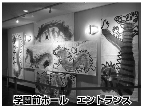
学園前ホール エントランス