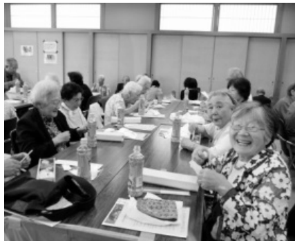
みんなで楽しく昼食

最後に「おたのしみ抽選会」を行いました。本年度は第20回大会を記念して各賞も増量し、大いに盛り上がりました。