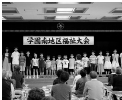
子ども達との歌声交流

今後実施してまいりますので皆様お誘いいただき多くの方の参加をお待ちしております。学園南地区の福祉の向上の為、皆様からの要望、意見をお聞かせください。今後ともご指導、ご協力を賜りますようお願い申し上げます。