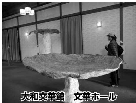
大和文華館 文華ホール