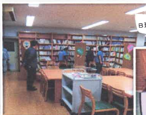
B班 図書室での誘導訓練

当日はB班として参加。まず誘導においては視覚障害者誘導介助訓練を初めて経験、部屋の中での短い距離ではありましたが床の段差、狭い通路、左右への誘導等すべて声に出して誘導することの重要性を痛感しました。また、体育館では車いす支援を実際に行い、細かい注意点を教わりながら貴重な体験をさせていただきました。当地区でも次年度以降、機会があれば訓練として実施したいと考えております。