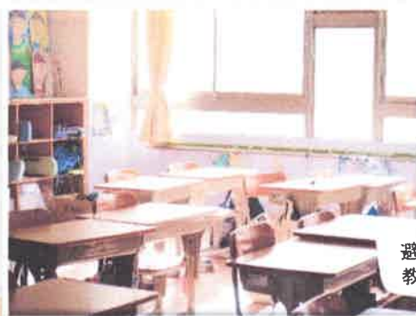
避難時に使用できる 教室・保健室