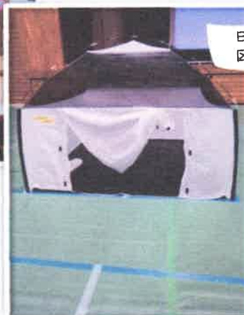
B班 体育館での区割りと資材組立